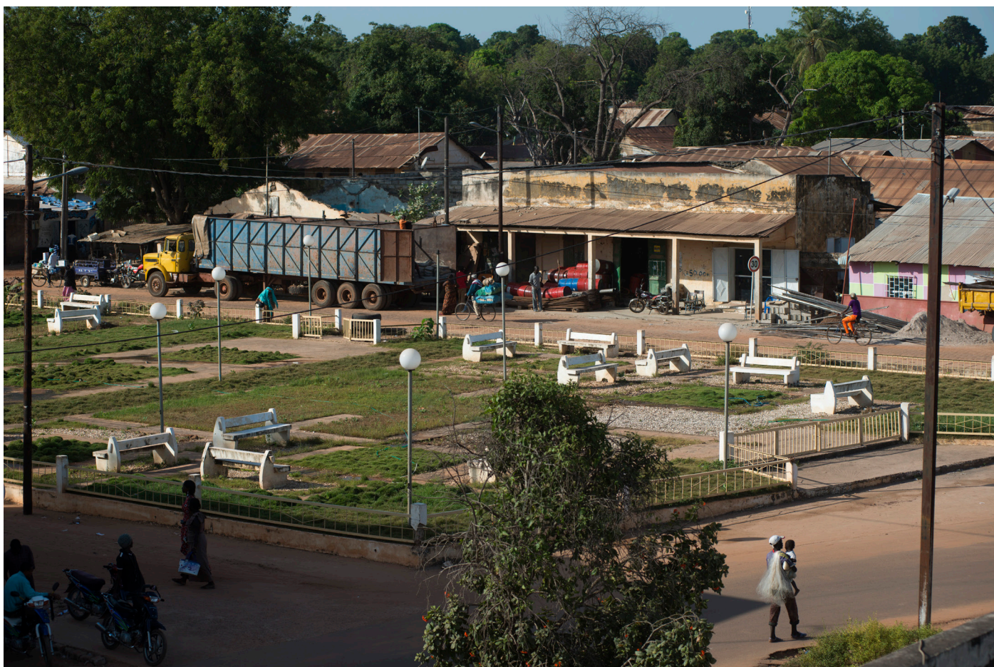
Le centre-ville de Sédhiou

«Nos jeunes vont travailler en zone sahelienne maintenant, c'est là-bas qu'il y a du boulot, pas chez nous, avant c'était l'inverse!»