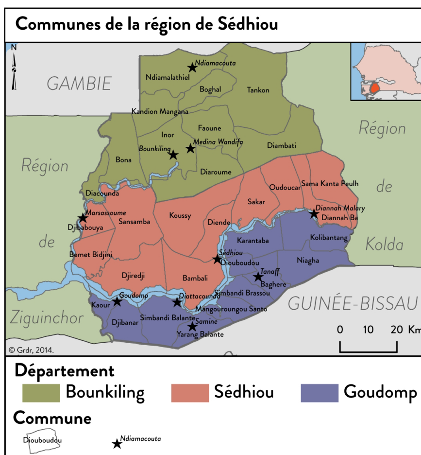
Carte de Sédhiou

La région est essentiellement rurale : l'agriculture reste l'activité dominante.