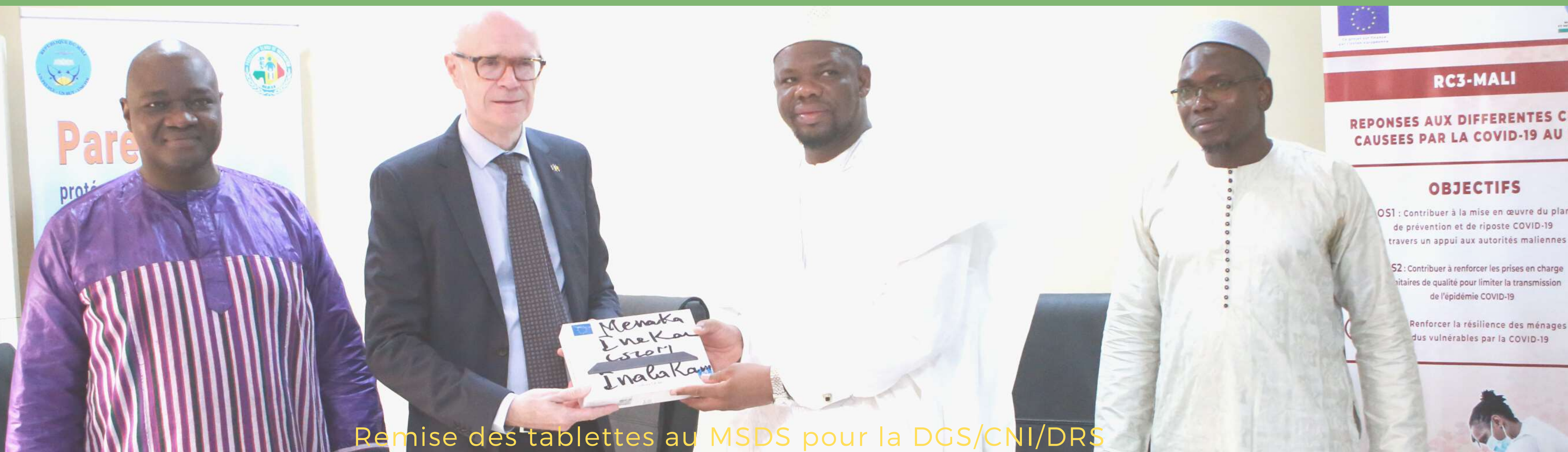
Remise des tablettes au MSDS pour la DGS/CNI/DRS